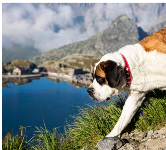
Les chiens saint-bernard.

Durant tout l'été, la Fondation Barry propose aux visiteurs, sur inscription, des promenades des chiens sur le col. Le chenil, accolé au musée, se visite également. Vous êtes les bienvenus pour découvrir ou redécouvrir les chiens emblématiques de Suisse. Anne-Sylvie Mariéthoz