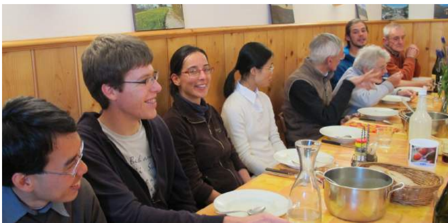
Une belle tablée de bénévoles.