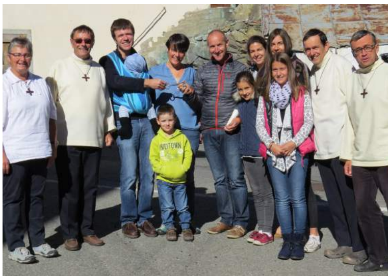
Passation des clés entre les anciens et les nouveaux gérants à l'automne 2017.