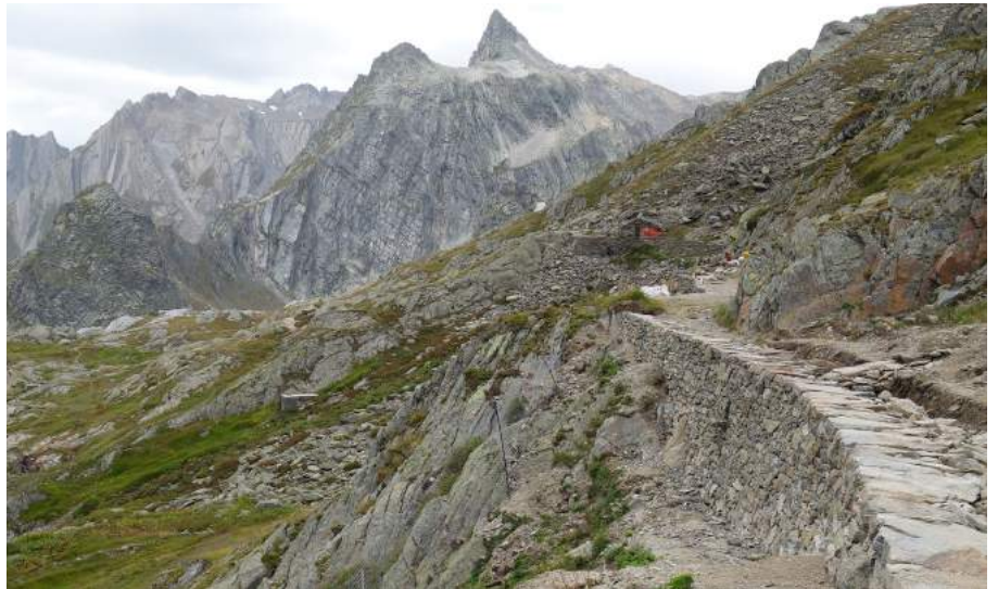
La promenade des chanoines.

Le FSP a décidé de soutenir ce projet car il s'agit d'un élément important (et millénaire!) d'un paysage traditionnel. Mais le FSP a également été sensible à deux aspects particuliers: le mur remplit une fonction essentielle en protégeant une conduite d'eau potable qui alimente l'Hospice. Sans elle, la vie sur le col et l'accueil risque-