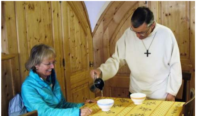
Bienvenue à l'Hospice du Grand-Saint-Bernard.

Quelle joie de se sentir accueillis de cette façon ! La présence des hôtes à l'Hospice a une grande valeur humaine.