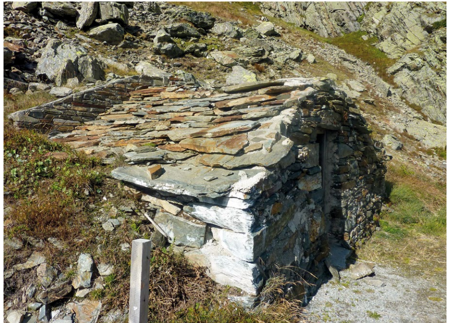
Cabane de la source.