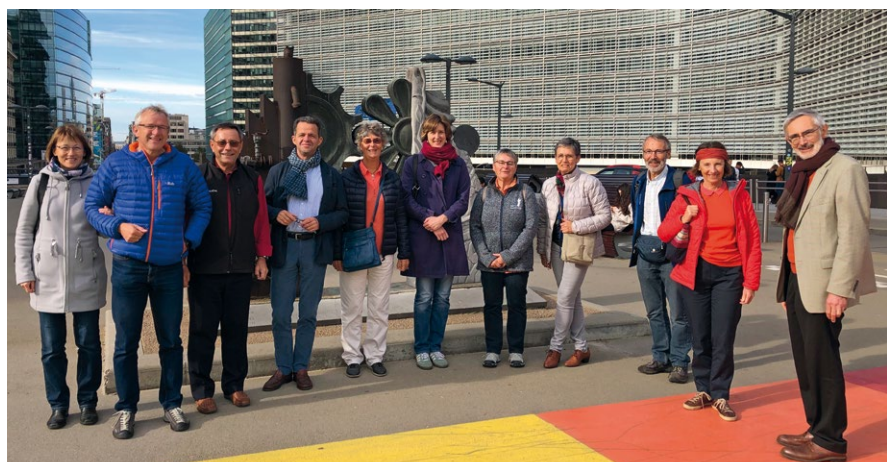
Quelques-uns des participants prennent la pause devant la Commission européenne.